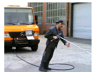
Arbeiten mit der Waschlanze.

KROLL Fahrzeugbau- Umwelttechnik GmbH, Rudolf-Diesel-Str. 85-89, 46485 Wesel, Tel.: 0281 - 95279-0, Fax: 0281 – 89650 E-Mail: info@kroll-fahrzeugbau.de Homepage: www.kroll-fahrzeugbau.de