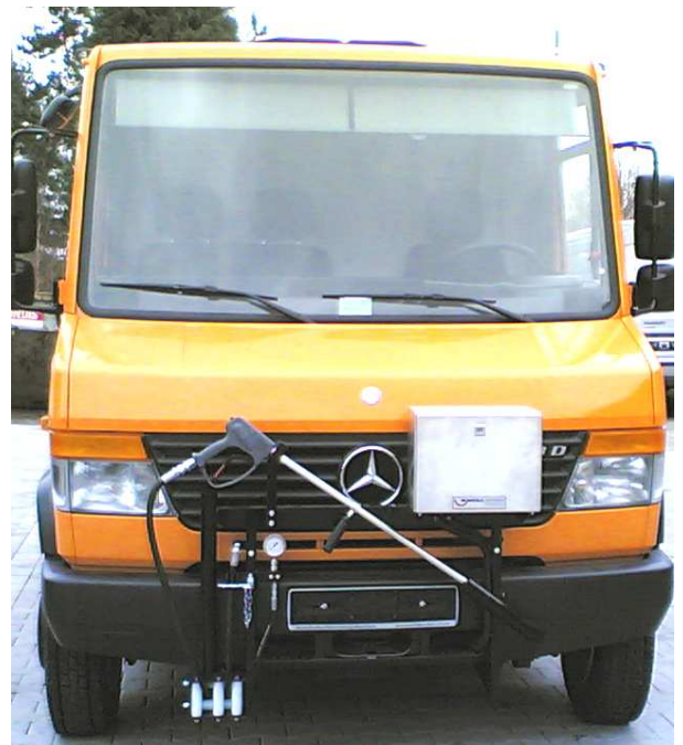
Beispielfoto: ROJET 70/140 WR eingebaut in einen Mercedes-Benz Vario. Andere Fahrzeugtypen möglich. Durch separaten Gerätemotor auch für Fahrzeuge mit Automatik-Getriebe geeignet.