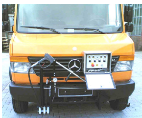
Bedienstand mit Schaltkasten, Waschlanze, Manometer, Umlenkrollen für 2 Schläuche.